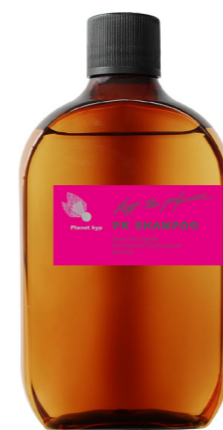
プラネットヒップ PKシャンプー 120ml

ヒップザパフューマー全8種のベースとなるヘアケアシリーズです。質感・効果など、サロンクオリティはそのままにお客様が好きな香りをセルフメイドして頂き、ラグジュアリーなバスタイムを演出するシリーズです。