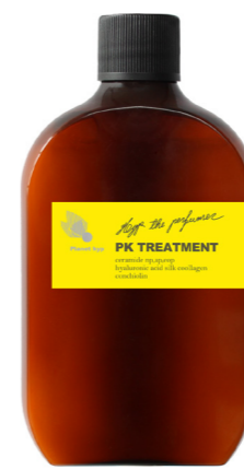
プラネットヒップ PKトリートメント 120ml