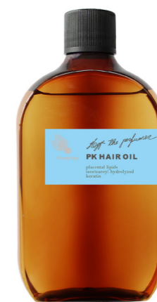
プラネットヒップ PKオイル 120ml