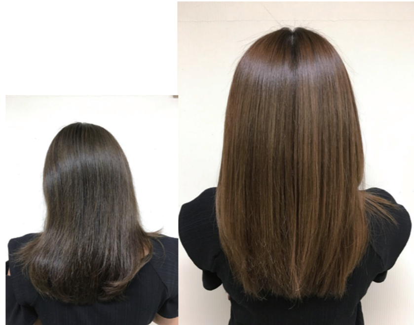
※仕上げはハンドブローのみ