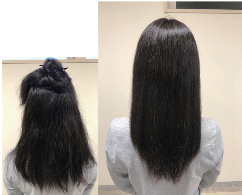
※仕上げはハンドブローのみ

クセを取めながら残留ティントを取り除きたい こんな方へ：ムラ染まりのカラー毛・白髪染めを明るくしたい方